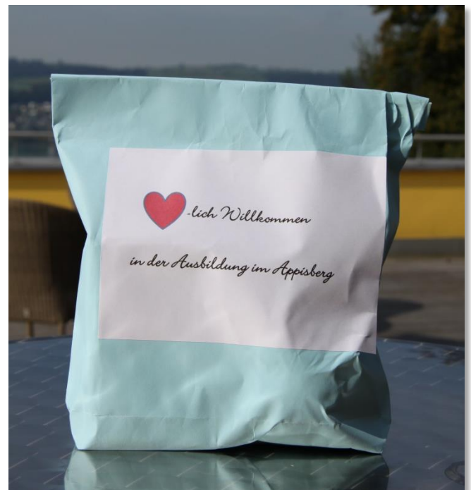
Starter-Kit für jede/n Lernende/n

Für 23 Jugendliche und junge Erwachsene war der 15. August 2016 ein besonders wichtiger Tag, nämlich der Start in ihre Ausbildung. Können Sie sich noch an Ihren Ausbildungsbeginn oder Ihren ersten Arbeitstag erinnern? Da mischen sich viele Gefühle und man wird eingedeckt mit einer Vielzahl neuer Eindrücke.