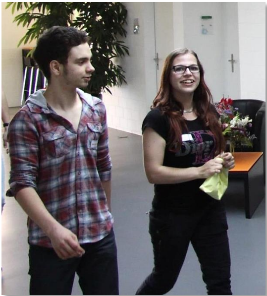
Gute Stimmung am ersten Ausbildungstag

Auf einem Rundgang bei bestem Wetter lernten die Neankömmlinge sich auf dem weitläufigen Gelände von APPISBERG zu orientieren und verschafften sich Einblicke in alle 9 Ausbildungsbereiche. Gleichzeitig stellten sich die an der Ausbildung beteiligten Personen vor und zeigten auf, welche Produkte und Dienstleistungen erbracht werden. Der Willkommenstag bot natürlich auch Gelegenheit die Mitlernenden über die Grenzen der Abteilung hinaus kennenzulernen. Das Eis war rasch gebrochen und die Lernenden standen in regem Austausch mit ihren Ausbilder/innen und Mitlernenden.